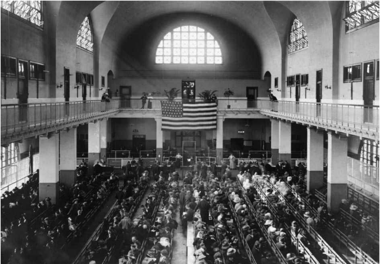
Einwanderer warten auf ihre Anhörung, um 1915

Wegen diesem ungewöhnlichen, aber doch ziemlich auffälligen Gegensatz: hier perfekte Papiere, dort ein stammelnder junger Mann, wurde Otto von den Beamten der Einreisebehörde zu einer Sicherstellung (Kaution) von US$ 500.- verdonnert ( heute rund € 7.400). Um dieses „Lösegeld“ zu beschaffen, benötigte er drei Tage und diese verbrachte er dort im Gefängnis.